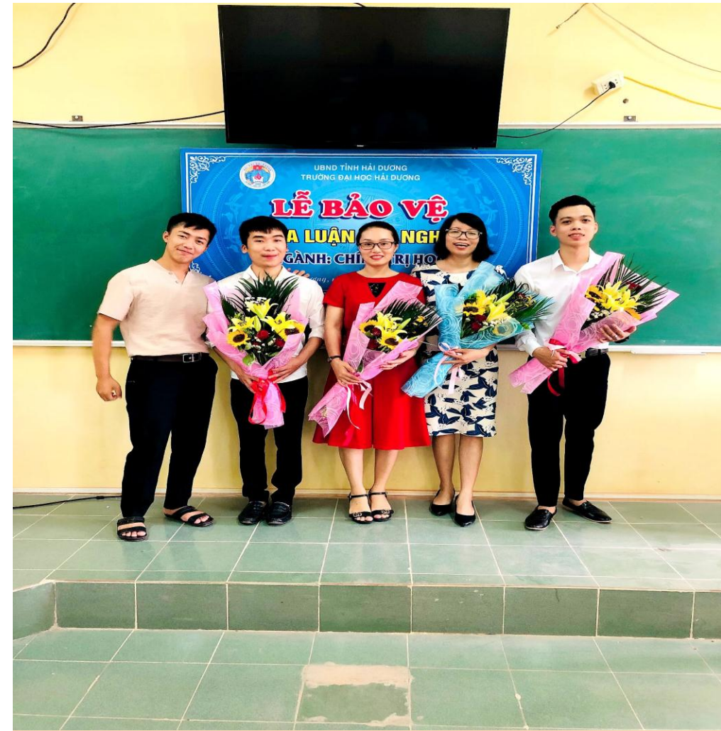
Lễ bảo vệ khóa luận tốt nghiệp của sinh viên ngành Chính trị học