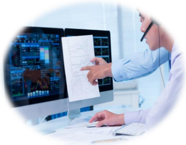
Cử nhân Tin học