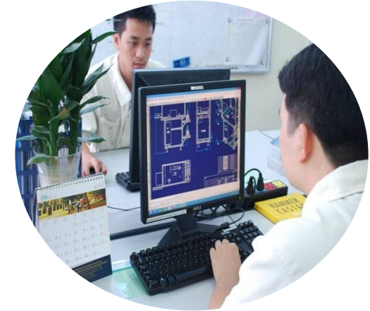
Chuyên viên CNTT