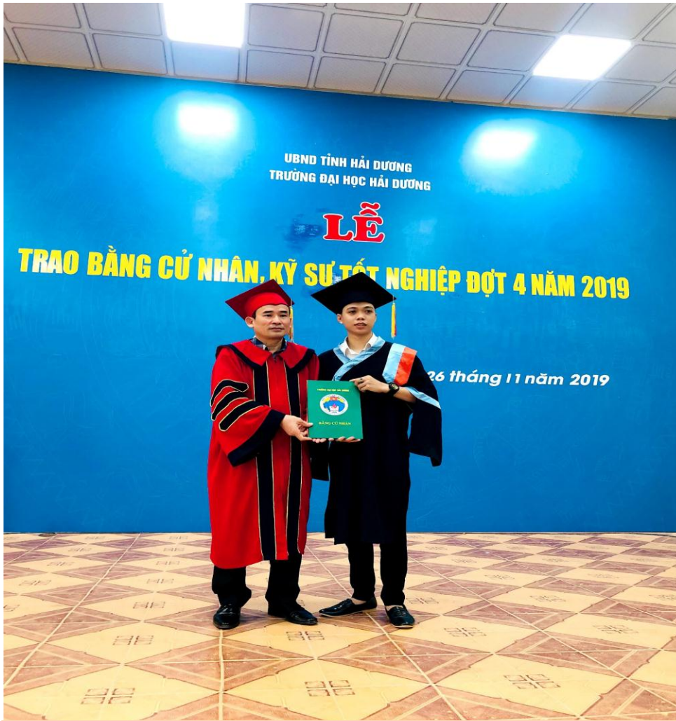
Sinh viên ngành Chính trị học nhận Bằng tốt nghiệp Năm 2019