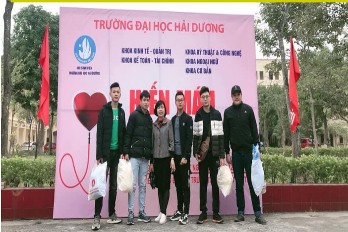
HOẠT ĐỘNG HIẾN MÁU TÌNH NGUYỆN