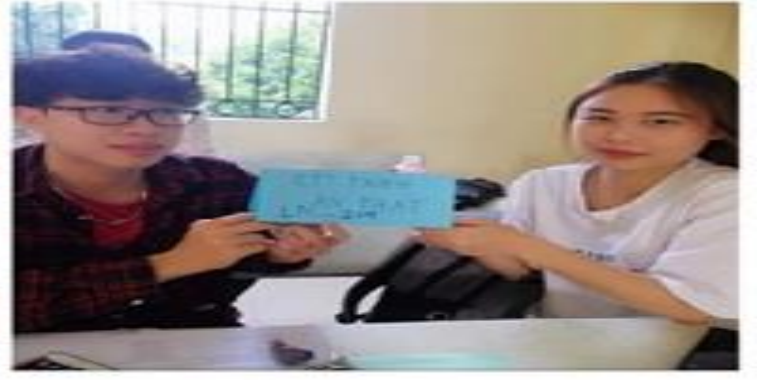
Sinh viên ngành Kinh tế tham gia thực hành học phần Khởi nghiệp