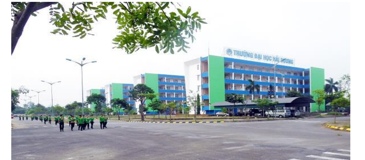
Khu Ký túc xá Trường Đại học Hải Dương