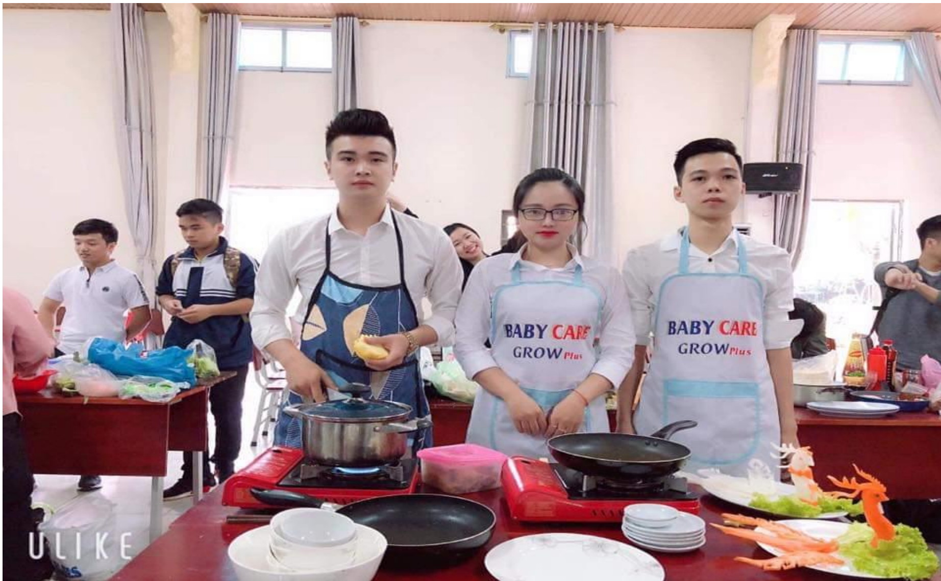
Sinh viên K5 ngành Quản trị văn phòng giành giải nhất trong Cuộc thi nấu ăn giữa các lớp sinh viên trong Nhà trường