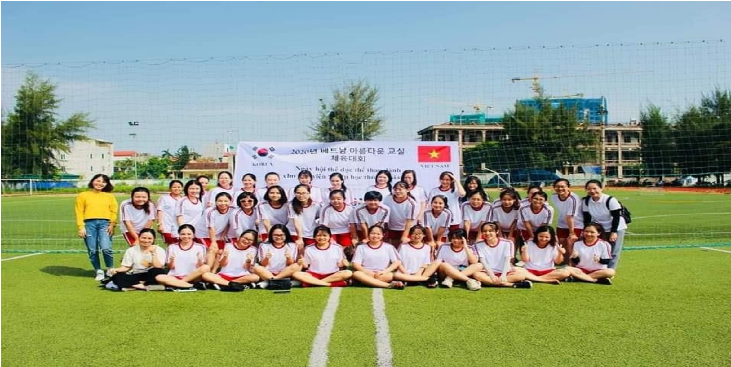
SINH VIÊN NGÀNH QUẢN TRỊ VĂN PHÒNG THAM GIA DỰ ÁN LỚP HỌC THÚ VỊ VIỆT NAM DO HÀN QUỐC TÀI TRỢ TẠI TRƯỜNG