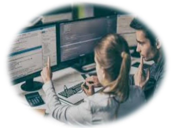
Kiểm thử phần mềm