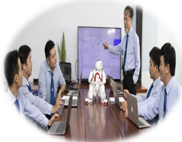
Giảng viên, chuyên gia nghiên cứu