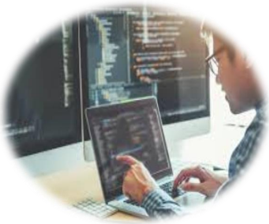
Lập trình viên